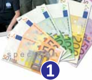
Den 1. Preis 2010 gewann der Stand von manCheck.